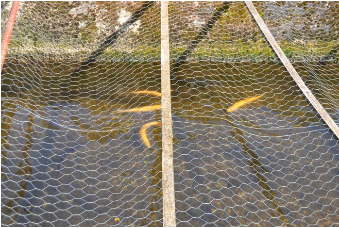
La truite jaune (ou dorée) a ses quartiers dédiés.