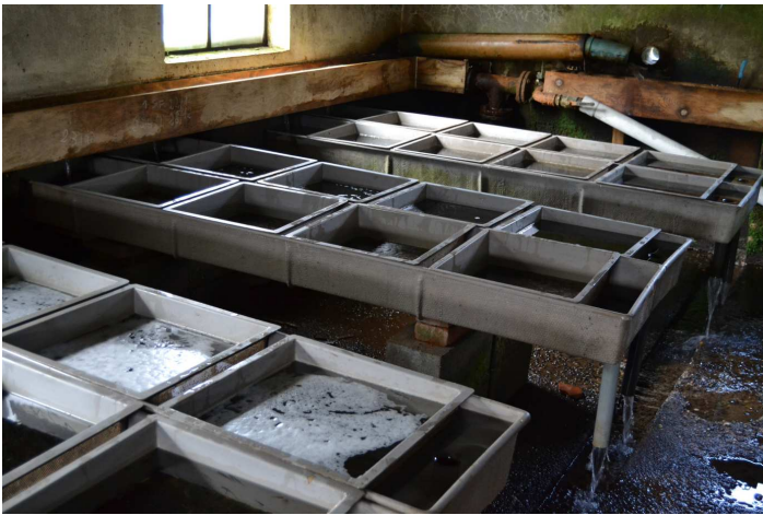
La "nursery" contient des centaines de milliers d'alevins, suivis et nourris dans leur croissance.