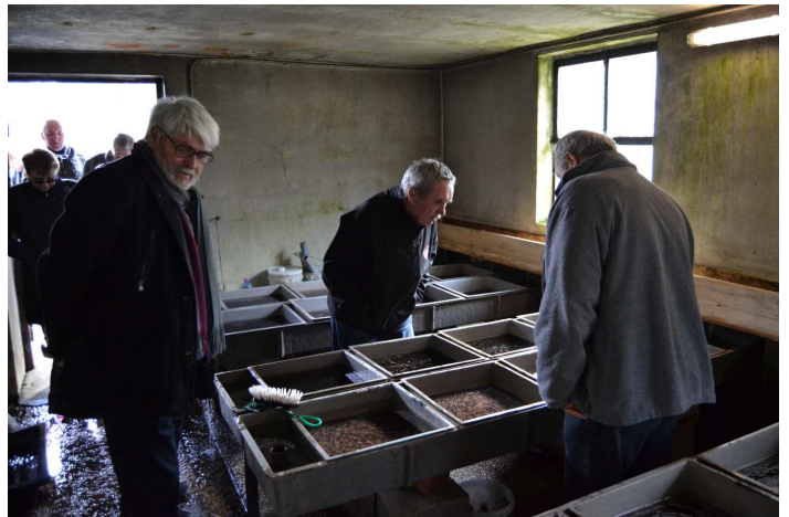
Chaque âge et chaque espèce ont leurs domaines.