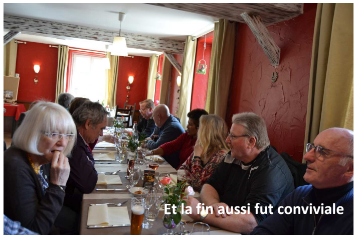
Et la fin aussi fut conviviale